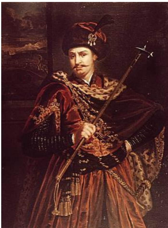
11. kép: Alíírás: Thököly Imre ifjúkori arcképe. Korabeli festmény

Az Erdélyben bujdosó Thököly Imre 1678-ban már fontos kapcsolatokat épített ki a bujdosókkal, majd bizonyos ügyekben Zrínyi Ilonával kezdett levelezni. 86 1680 februárjában Makovicán személyesen is találkoztak. Thököly tárgyalást folytatott az özvegy fejedelemasszonnyal csapatai elhelyezéséről.