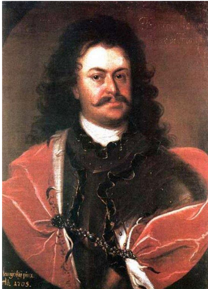
14. kép: II. Rákóczi Ferenc arcképe, Mányoki Ádám festménye

Hamvait fia és férje földi maradványaival együtt hozták haza 1906-ban, majd őt és a Nagyságos Fejedelmet a kassai Szent Erzsébet-dóm kriptájába helyezték örök nyugalomra.