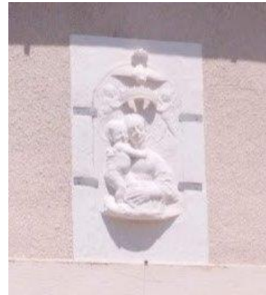
3. kép: Bribir – ahonnan a Zrínyiek származtak. A régi templom reneszánsz Madonnája a déli kapu bejárata fölött