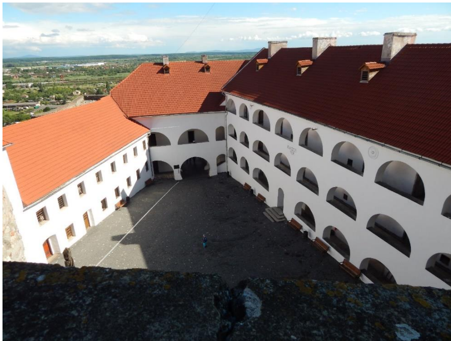
12. kép: Munkács vára

A nagyasszony a végsőkig, 1688 januárjáig kitartott Munkács védelmében – bátorságával egész Európa csodálatát kiváltotta. A hosszúúra nyúlt ostrom idején nemcsak irányította a védelmet, intézte a hadi és a gazdasági ügyeket, hanem ápolta a sebesülteket és betegeket, erőt és reményt nyújtott katonáinak, cselédeinek, sőt még a híres Ilona-napot is rendre megtartották. Reménykedve írta leveleit férjének, de mivel Thököly nem tudta felmenteni a várat, az úrnő kénytelen volt a megadás mellett dönteni. Őt magát és gyermekeit Bécsbe vitték. Javaitól, birtokaitól, sőt – az ígéret ellenére – gyerekeitől is megfosztották, és hiába könyörgött azért, hogy legalább láthassa őket.