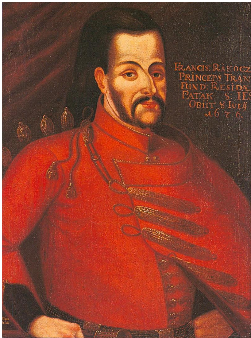
6. kép: I. Rákóczi Ferenc választott erdélyi fejedelem

Patakot 12 még a fejedelmi nagyapa, I. Rákóczi György (1630–1648) rendezte be magyarországi fő rezidenciává, amelyet majd özvegye, Lorántffy Zsuzsanna épít tovább. Az unoka, I. Rákóczi Ferenc valóban fejedelmi udvart tartott fenn Sárospatakon; 27 főember szolgája, 22 étkefogója, 7 pohárnoka, 8 asztalnoka volt, akiket szakácsok, ajtónállók, tálmosók, inasok, szolgák stb. hada látott el mindennel. Az úr biztonságáról 300 lovas és kékgyalog, 30 udvari zöldpuskás gondoskodott, nem beszélve a várbeli kapuőrökről, pattantyúsokról és az uradalmakat igazgató gazdasági szakemberekről, provisorokról, jószágkormányzókról, vincellérekről, kulcsárokról, majorosgazdákról, majorosnékről, lovászokról stb. Az ifjú fejedelemasszonynak külön udvartartása volt. A teljes személyzet éves fizetése készpénzben