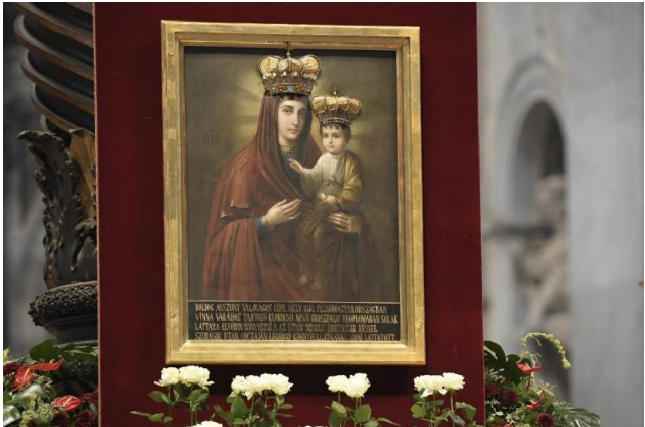
15. kép: A klokocsói Istenszülő kegykép magyar felirattal ellátott másolata, amelyet a Kassai Egyházmegye szlovák görögkatolikus hívei vittek Rómába, a Szent Péter-bazilikába

Az eperjesi első másolatról további két másolat is készült, amelyen azonban már nincs semmiféle felirat. 105 Erről a másolatról készítettek a szlovák görögkatolikus hívek másolatot és vitték Rómába, a Szent Péter-bazilikába, amely előtt Ferenc pápa imádkozott 2021. június 29-én, Szent Péter és Pál ünnepén. 106