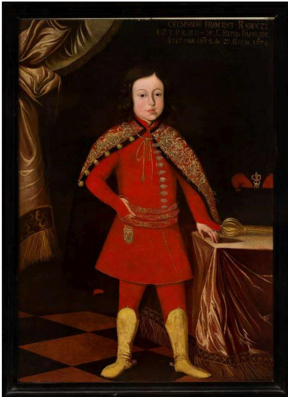
10. kép: II. Rákóczi Ferenc gyermekkori képe

kezelésének kérdése, 66 de az özvegy fejedelemasszony az uralkodótól újabb védlevelet kapott. 67