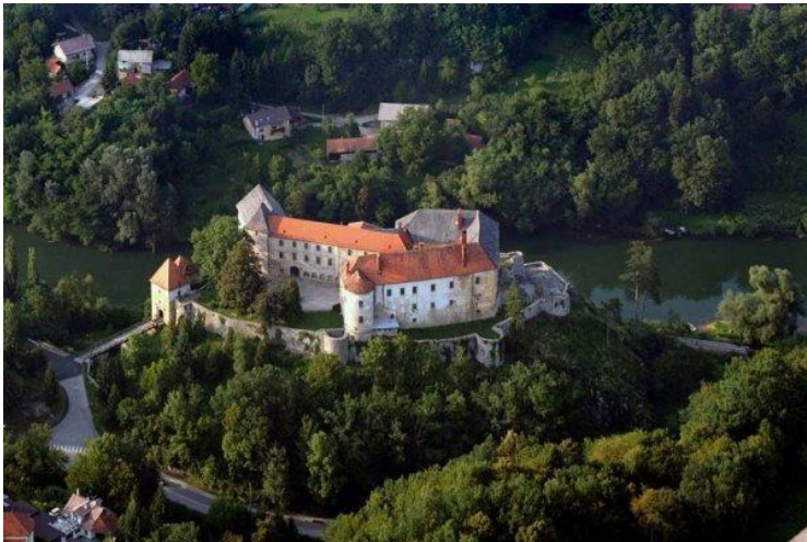
2. kép: Ozaly vára, a Zrínyiek ősi fészke

Az újabb kutatások azonban egy régebbi, elfelejtett publikációra hivatkozva tisztázták Zrínyi Ilona születési idejét, amely 1649. március 20-án volt. 1 Tehát való igaz, nem 23 évesen adták férjhez a Zrínyiek hajadon leányukat, és idősebb sem volt vőlegényénél. Azonban a párválasztás sem volt szokványos; I. Rákóczi Ferenc (1645. február 24. – 1676. július 8.) választott erdélyi fejedelem számára a menyasszonyt édesanyja, Báthory Zsófia özvegy fejedelemasszony szemelte ki; az elvesztett fejedelemség helyett családi birtokaikra, Északkelet-Magyarországra visszavonult Rákóczi család egyetlen férfitagjának a távoli horvátországi Ozaly 2 várában székelő, a törökök ellen vitézkedő Zrínyi Péter leányát. Eltökélt szándéka az volt, hogy az egyetlen Rákóczi-sarj továbbvigye a nemzetséget házasságával. Zrínyi Miklós (1620–1664) horvát bán ügyvédje és barátja 1663 januárjában azt írta, hogy a Zrínyi leánynak már a festett képét 3 is elküldték Munkácsra, ekkor a fiatal menyasszonyjelölt még be sem töltötte 14. életévét. Ám az eljegyzés csupán két és fél év után, 1665 nyarán következett be. 4 Miért csak ekkor?