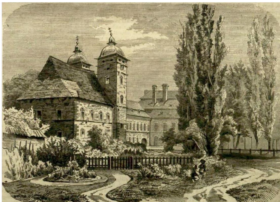
5. kép: A zborói kastély – metszet