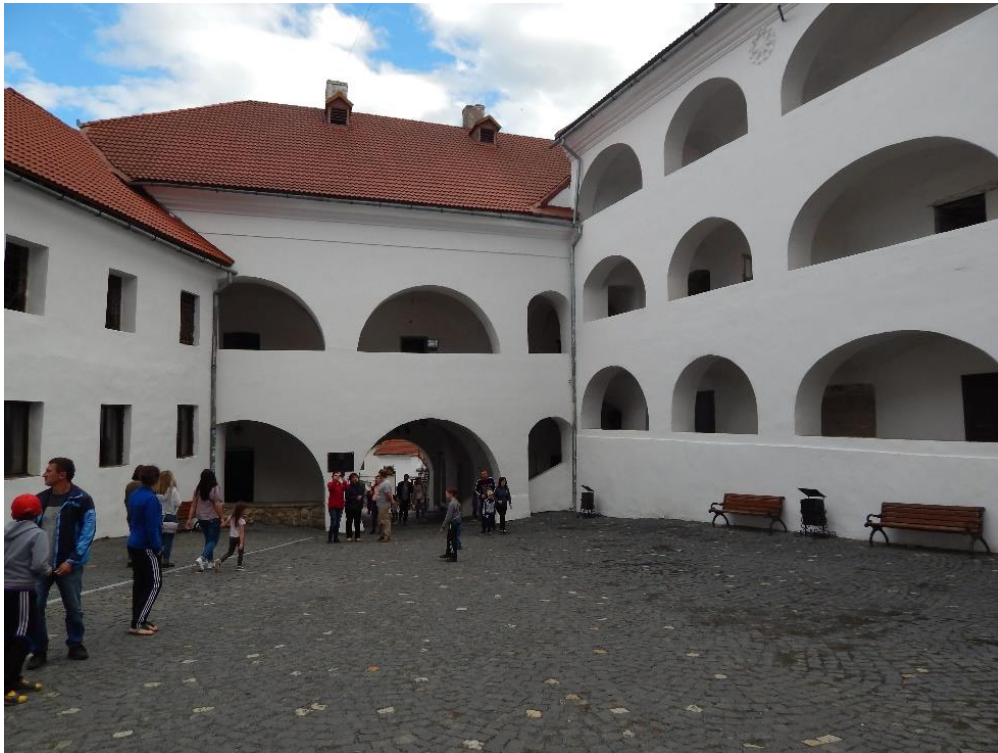
13. kép: Munkács vára, a belső udvar

A remény csupán Thököly Imrének török segítséggel Erdélybe történt betörése és a győzelmes zernyesti csata (1690. augusztus 21.) után villant fel; ugyanis tudomására jutott, hogy az elfogott Donathus Heisler tábornokért és Doria ezredesért cserében talán kiszabadulhat a bécsi fogságából. „Isten áldja meg kegyelmedet, szerelmetes uram, minden áldásával. [...] Csak azt óhajtanám tudni, mi lesz velem? Kegyelmed itt akar-e hagyni, avagy kiváltani? Szépen kérem kegyelmedet, jó uram, bánjon emberségesen a foglyokkal, mert attól tartok, hogy ellenkező esetben velem is keményebben bánnak. Egyébként a jó Istenre hagyom magamat, és kegyelmed szeretetére. Nagy kincs a házastársak között az igaz szerelem és a lekötöttség. Ebben maradok én kegyelmednek igaz hitestársa!” – írta a fejedelemasszony férjének. 95 Mivel a foglyocseréről szóló tárgyalások igen akadoztak, Zrínyi Ilona egyre türelmetlenebbül várta a híreket Thökölyről és az eseményekről. 1691. november 25-én, Kinsky grófnak címzett levelében ismét tanúságot tett határtalan szerelméről és önfeláldozásáról: