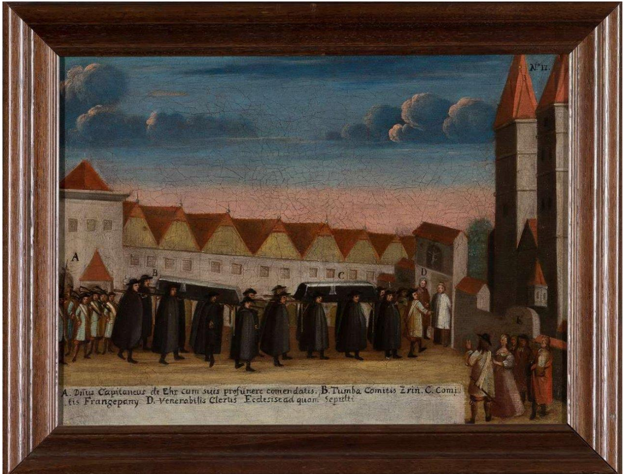
8. kép: Zrínyi Péter és Frangepán Ferenc temetése 1671-ben. Ismeretlen festő, XVII. század

klagenfurti kolostorba zárták. 42 Zrínyi Ilonának nem volt többé sem ősi családi fészke, 43 sem rokonsága, János öccsét 44 leszámítva; 1670-ben a hullámok már összecsaptak a család feje fölött. 1671. április 30-án Bécsújhelyen kivégezték édesapját, gróf Zrínyi Pétert és anyai nagybátyját, gróf Frangepán Ferencet.