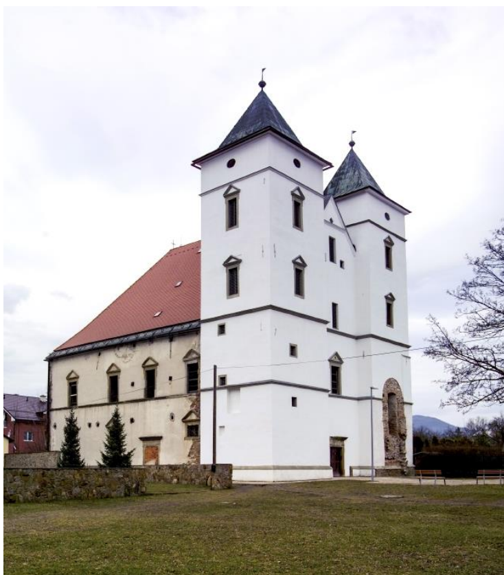
4. kép: A zborói reneszánsz építésű templom