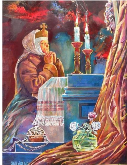
10. kép: Gizella királyné éjszakai imája

Időben nagyot ugorva, megemlíthető I. Ferenc József felesége, Erzsébet királyné (1837–1898), aki bár szíven viselte a magyar érdekek képviselőjét, ugyanakkor nem igyekezett mintát adni a társadalom számára. Jóllehet, az uralkodóházak minden esetben mintaadó szereppel is rendelkeztek, minőségi példázatot igyekeztek nyújtani, amely egyben mindenki számára megvalósítandó érték és cél volt.