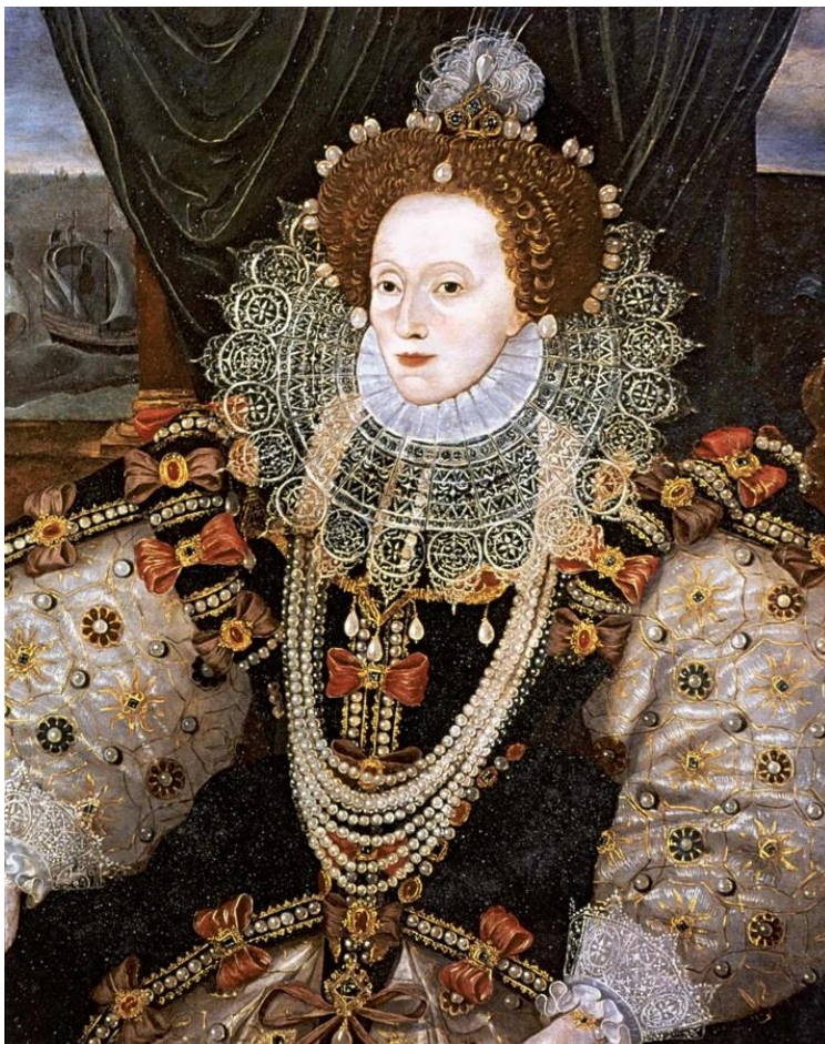
13. kép: I. Erzsébet angol királynő

I. Erzsébet angol királynőt (1533–1603) viszont kiemelkedő áldozathozatala miatt említeném. Amint az ismeretes, annak érdekében, hogy összetartsa a nemzetet, lényegében feláldozta magánéletét. Sőt, mondhatni, azon túlmenően nőiségének megélését és kiteljesítését is a hazáért, hiszen uralkodása alatt erősödik meg az anglikán egyház és Anglia hatalmi helyzete.