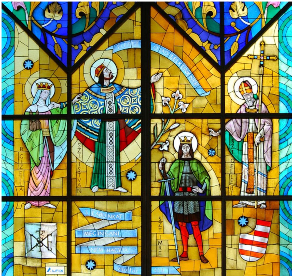
3. kép: Szent István és családja, Gizella társ az uralkodásban

Tizenhat éves volt, amikor Domonkos érsek királynévá koronázta. „Miközben királynéi koronáját a fejére helyezte, a következőket mondhatta: Vedd a dicsőség koronáját és tudd, hogy te is részese vagy a birodalom kormányzásának, s az Úristen népének mindig eredményesen viseld gondját.” 13 A későserdülő-koraifjú korba érkező lányok, kilépve belső világukból - ahogy a mesék is üzenik -, a „Naplányia korszakukat” élik. Azon archetípus aktiválódik bennük, amelynek ereje, az előző életszakasszal éppen ellentétesen, cselekvésre hívja és a külvilág felé hajtja őket. Gizella is „ennek megfelelően” társuralkodó lesz az egyházszervezésben, s mint királyné, férje segítőtársa az országkormányzásban.