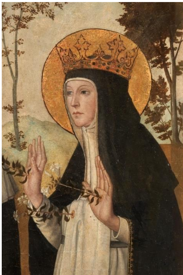
2. kép: Árpád-házi Szent Margit

Boldog Gizellával szemben Szent Margit, elfogadva a külvilágtól való végleges elvonulást, az Istennek szentelve magát, a „belső várkastély” felfedezésének egy életre szóló útját választotta. Nem lépett tovább a nő evilági kiteljesedéséhez vezető következő lépcsőfokra.