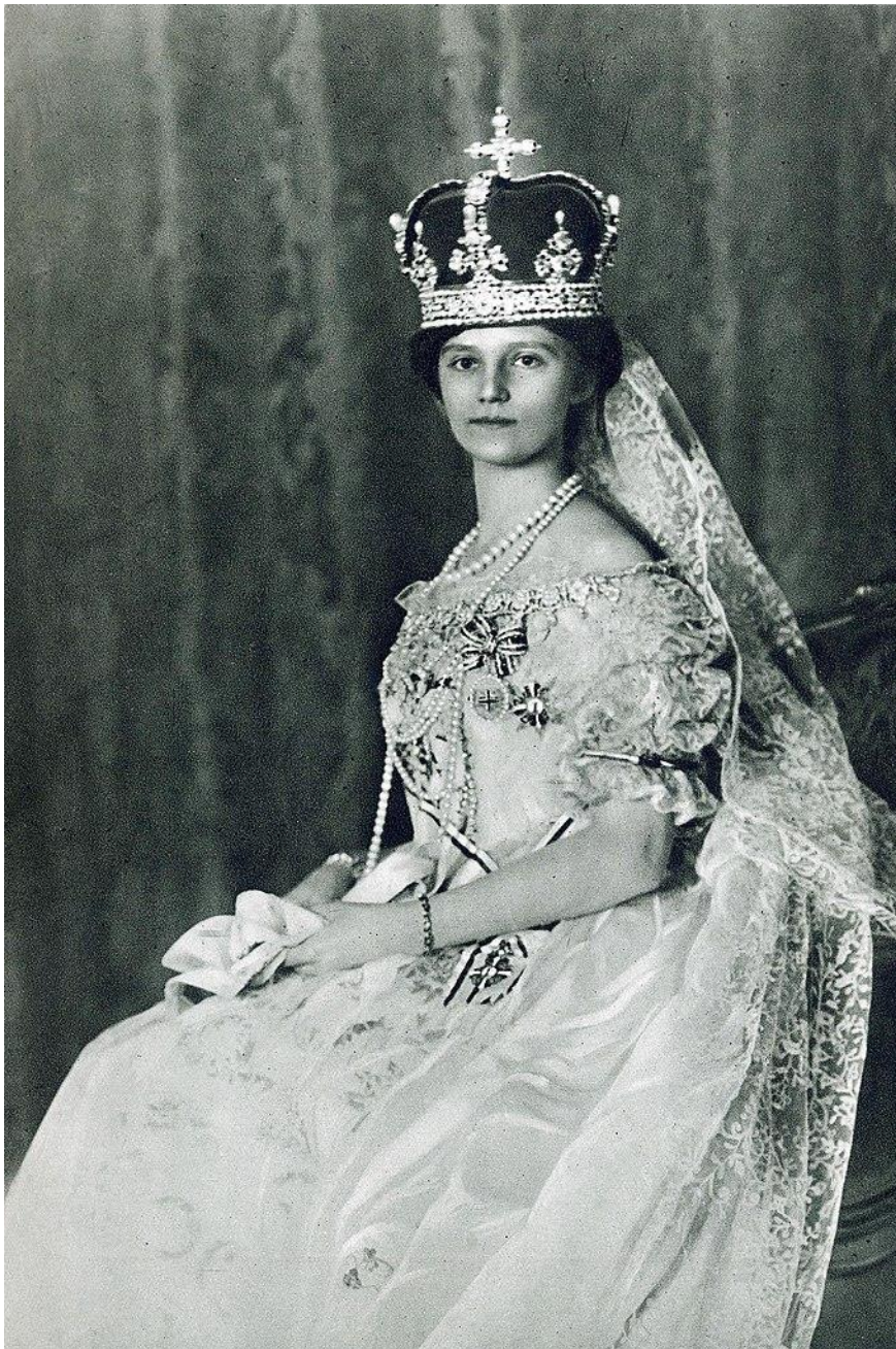
15. kép: Zita királyné a királykoronázáskor

Ám nem mehetünk el szó nélkül ezen összefüggések tekintetében az utolsó magyar királyné, IV. Károly felesége, Zita (1892–1989) esete mellett sem. Mártír szerepével trónfosztásban és száműzetésben részesült hitvese társ mártíriumát hordozta. Férjét és elvesztett uralkodói státuszát egész életében gyászolta, sem jogilag, sem lelkileg nem mondva le királynői szerepéről és méltóságáról. Hitének és meggyőződésének erejét bizonyítja, hogy 1989-ben bekövetkezett halálakor Straub F. Brúnó, az Elnöki Tanács Elnöke koszorút küldött sírjára. Vagyis még a kommunista Magyarország vezetése is, végül egy gesztus erejéig, elismerte az egy életen át fenntartott királynői szerepigényt .