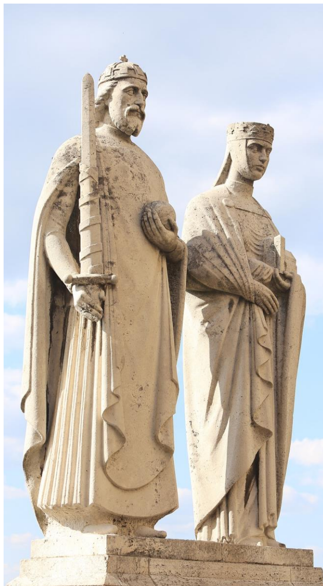
5. kép: Szent István és Gizella

A női kiteljesedés és fejlődés – a lányból nővé, a nőből feleséggé, majd anyává, s egyben társsá válás – útjának fontos állomásához érkeztünk: Gizella, már mint érett nő , képes anyaként a gyermekeit, családját, udvartartását gondozni, és mellette a királynéi birtokok és udvarházak működéséről is gondoskodni. Megadatot számára, hogy megélje és betöltsen anyai , majd úgy a szűkebb, mint tágabb környezetében a családanya archetípusához kötődő segítő, támogató, megtartó és egyben fejlődést előmozdító küldetését. Férje mellett munkatárs az egyházszervezésben, részt vesz az országkormányzásban. Nevéhez kapcsolódik többek között a veszprémi székesegyház, a veszprémvölgyi görög apácázárda, a Nyitra melletti monostor, a bakonybéli apátság építtetése, továbbá az egyházi ruhákat készítő műhelyek létesítése. „Gizellának és munkatársainak kb. 300-350 templomot kellett ellátniuk miseruhával, kehelyfehéreneművel és oltárterítővel.” 15