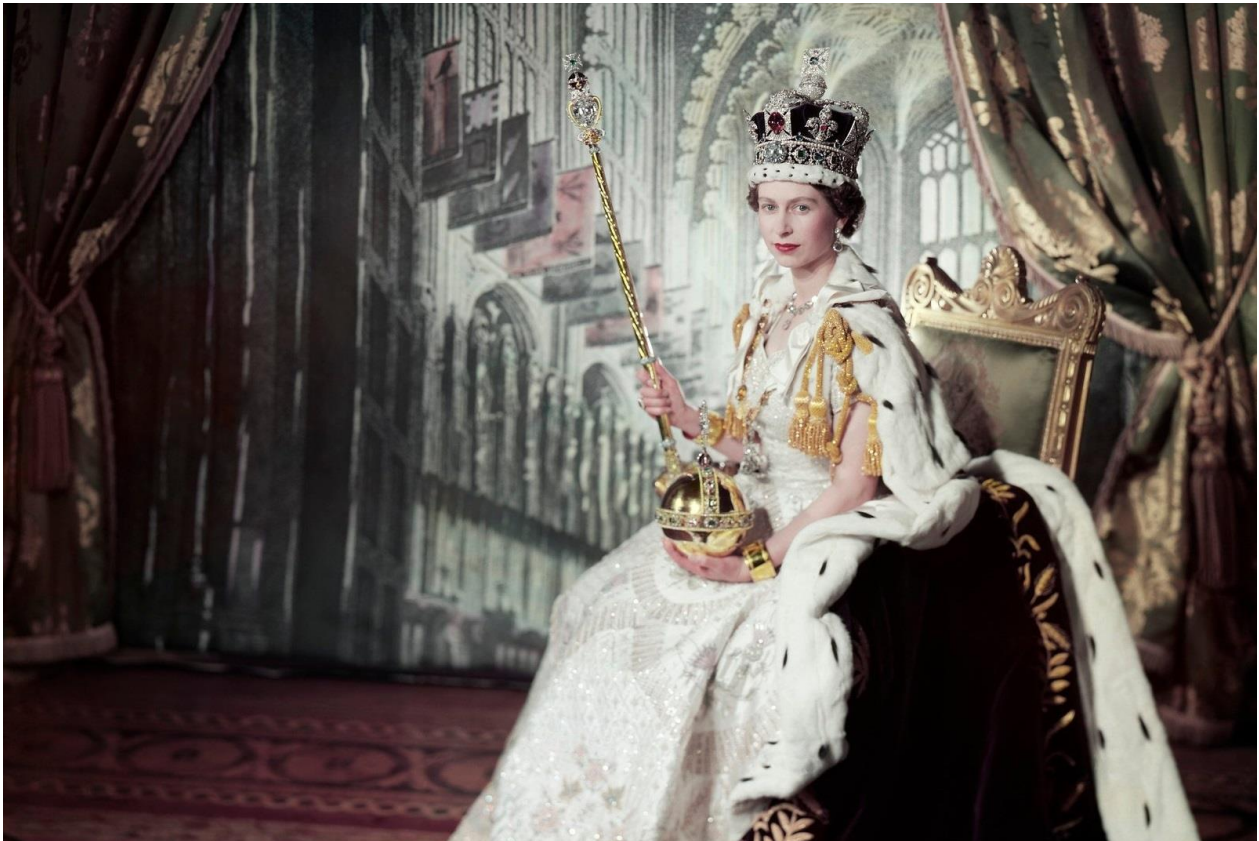
8. kép: II. Erzsébet koronázási portréja (részlet)

Visszatérve II. Erzsébethez, az ő döntéseiben és vállalásaiban mindjárt a kezdetektől úgyszintén megtalálhatjuk az alárendelődés és alázat erőteljes motívumait. Még élete utolsó éveit is a másokon való segítség, a rászorulókat támogatása, az adományozás, összességében az élet védelmére irányuló törekvések töltötték ki.