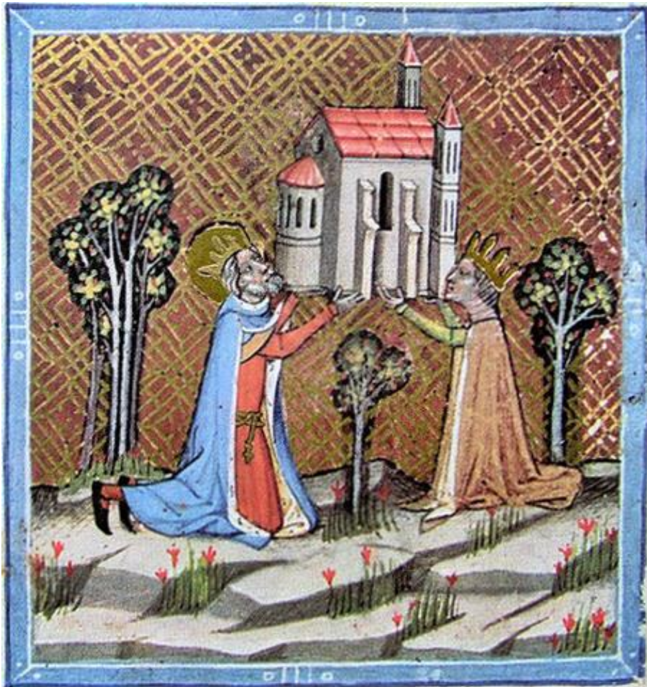
9. kép: Szent István király és felesége Óbudán templomot alapít

Gizella királyné, amint az korábban már említésre került, társuralkodói szerepet is betöltött, azaz olyan feleség volt, aki részt vett különféle, a királyság intézményrendszerét megtestesítő létesítmények megalkotásában, valamint a vallásos érzület és hit meggyökereztetésében. A Képes Krónikában olvashatjuk, hogy István és Gizella közösen alapítják meg az óbudai prépostságot.