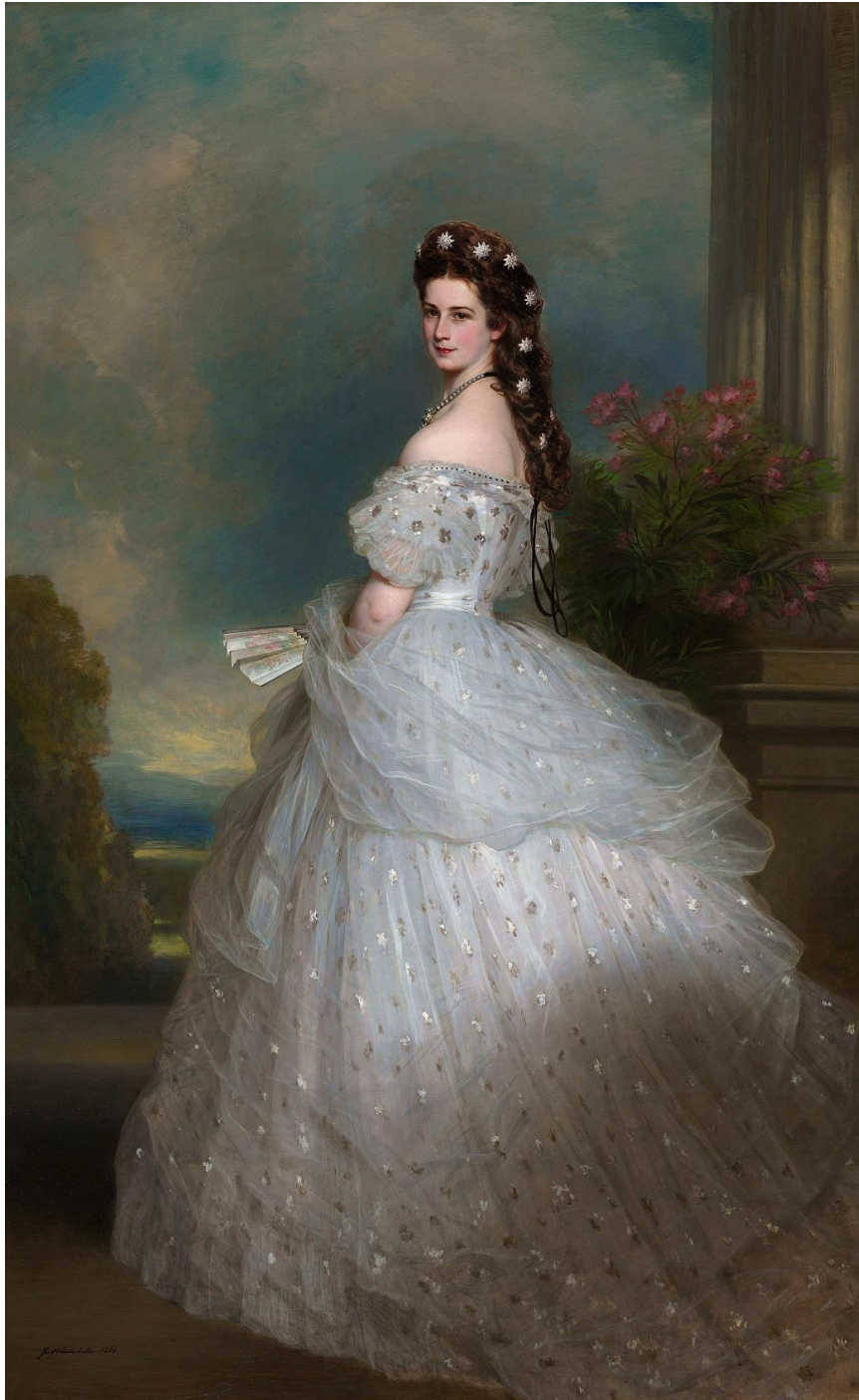
14. kép: Erzsébet császárné és királyné

A mi Erzsébet királynénkat viszont – pozitív tulajdonságai és értékei mellett – éppen, hogy az áldozathozataltól való elfordulás jellemezte. Mintegy belesüllyedt, mondhatni a privát életbe, s nem tudta képviselni a császár és királynéi méltóságtól elvárt, a korábbiakban már említésre került archetipikus működésmódot. Kicsit narcisztikus, depressziós magatartással találkozunk XVI. Lajos francia király felesége, Mária Antoinette (1755–1793) esetében is, aki szintén nem töltötte be azt a szerepet, melyet a francia nemzet elvárt volna tőle. Menekült a közérdek szolgálata elől.