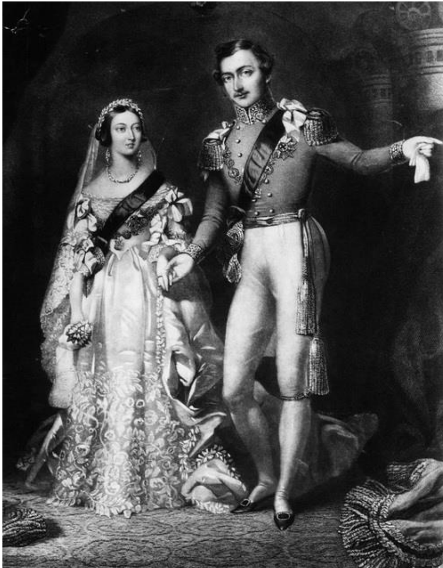
11. kép: Viktória királynő és Albert herceg az esküvő reggelén

Bizonyos tekintetben rokonítható vele Mária Terézia (1717–1780) , akinek életében viszont az anyai hivatás domborodott ki igazán. Ez nem pusztán gyermekeinek nagy száma okán említendő, hanem az ezzel összefüggésben lévő anyai szerepnek az uralkodói szerepbe történő beágyazódása folytán is. Figyelemre méltó, hogy miközben komoly ellentétek feszültek az örökös tartományok és Magyarország között, Mária Teréziának ez a fajta anyai, gondoskodó szerepe hatást gyakorolt a magyar nemzeti közvéleményre és aktiválta a mindannyiunkban ott lévő anyaarchetípust . Jellemző volt Mária Teréziára az emberi esendőségeket megértően kezelő, anyai, védelmező, támogató attitűd is. Egyfajta anyai odafordulás az alattvalókhöz jellemezte. A magyar nemzeti-népi emlékezetben így élt Mária Terézia, ami felülírta a Habsburg–Lotharingiai-ház és a magyarok között a politikai problémákat és feszültségeket. 21