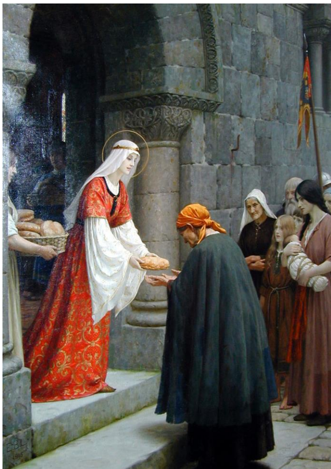
7. kép: Árpád-házi Szent Erzsébet kenyeret oszt a szegényeknek

A háborút tehetetlenül elszenvedő – leginkább a serdülőkort, azaz a „Hófehérke archetípust” megidéző – működésmód helyett az akkor még csak főhercegnő a hősiességek is beillő cselekvést választotta: a brit hadsereg kapitányaként sebesülteket szállító teherautót vezetett. Ezen igazságot tevő és kereső életszakasz archetípusáról a csak a 20. században szentté avatott Jeanne d’Arc (1412–1431) alakja juthat eszünkbe. Ám amíg Erzsébet, Gizellához hasonlóan több fejlődési állomást megélve és személyiségébe integrálva tovább tudott lépni egy következő életszakaszba, Jeanne d’Arcnak ez nem adatott meg.