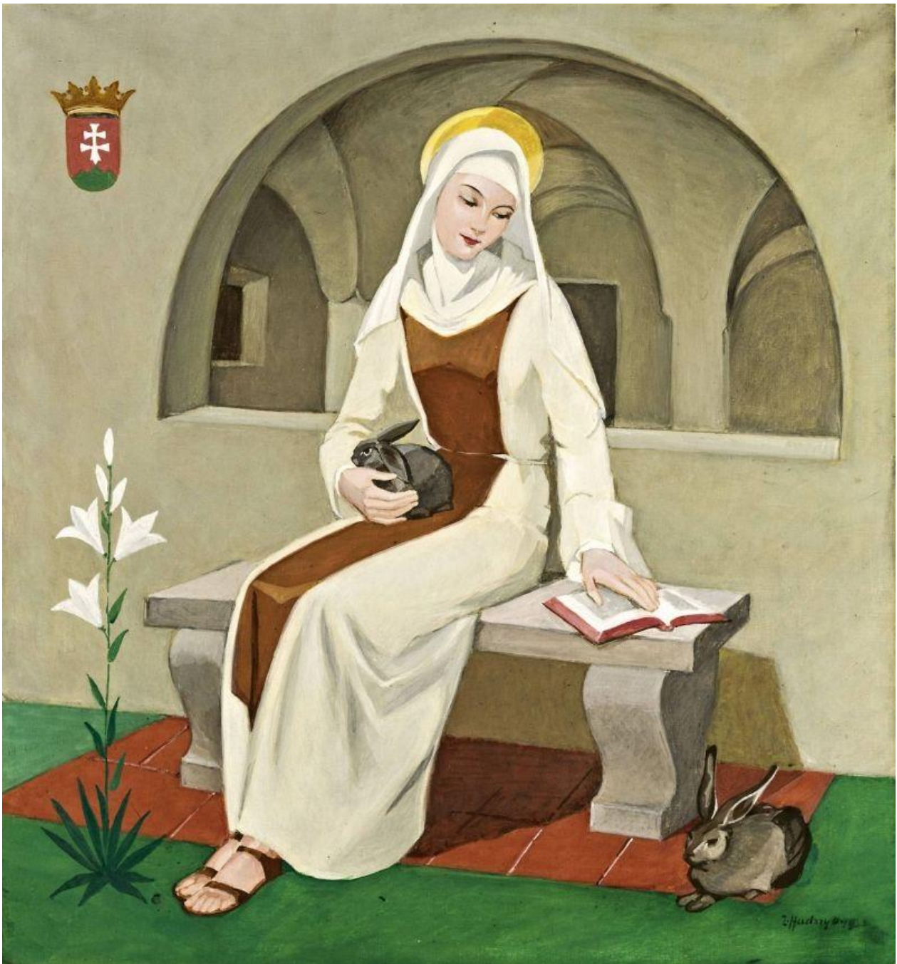
1. kép: Árpád-házi Szent Margit a Nyulak-szigetén

Mindezen tulajdonságok később, a kora serdülőkor után, több fejlődési szakaszt követően, leginkább az anyai identitásban teljednek ki, ám kibontakozásukhoz meghatározó időszakot képez a kora serdülőkor.